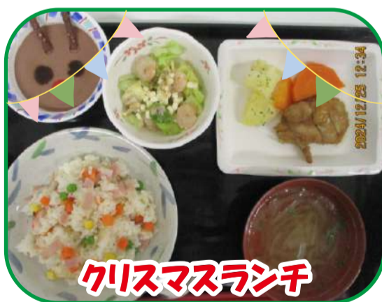
クリスマスランチ