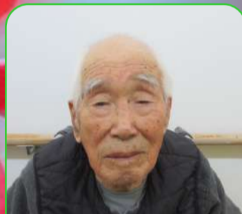
元亀の里 木下林様